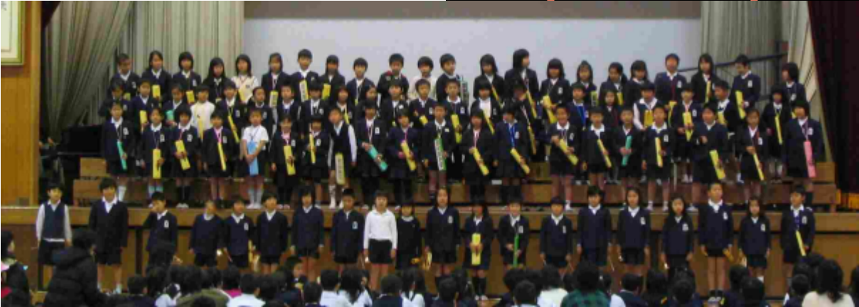
2年生85人が心を一つにして演奏しました。とても元気よく楽しくできました。